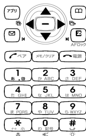
図 3: 対象とした携帯電話のキー配列