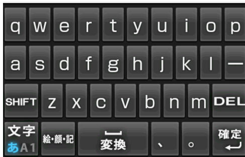
図1 スマートフォンのソフトウェアキーボードの例

を配置する必要があるため、必然的に個々のキーが小さくなるため、fat finger 問題が発生する代表的な事例である。